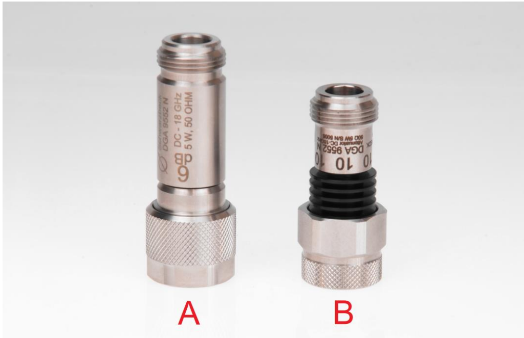
Beispiel für 6 dB “Typ A” und 10 dB “Typ B” Dämpfungsglied. Example photo of a 6 dB “Type A” attenuator and 10 dB “Type B” attenuator.